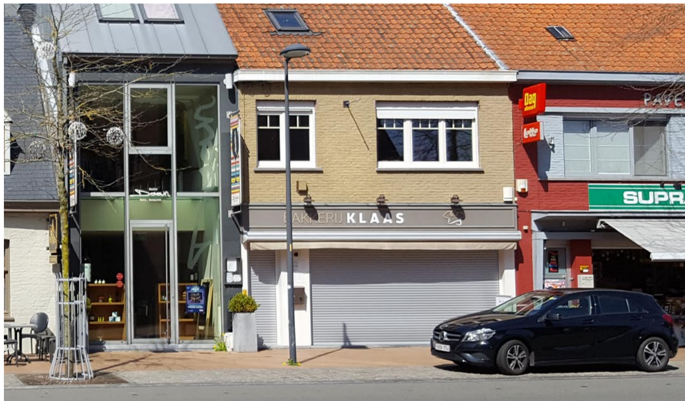
Situatie in 2018: nu bakkerij Klaas

Toen klompenmaker (in Hulste kloefkapper ) Petrus Ottevaere en Julia Deganck in 1877 trouwden openen ze deze herberg. In 1883 verhuisden ze twee huizen verder, naar het nummer 13, en openen daar een nieuwe herberg met de toepasselijke naam: In de Gouden Kloef .