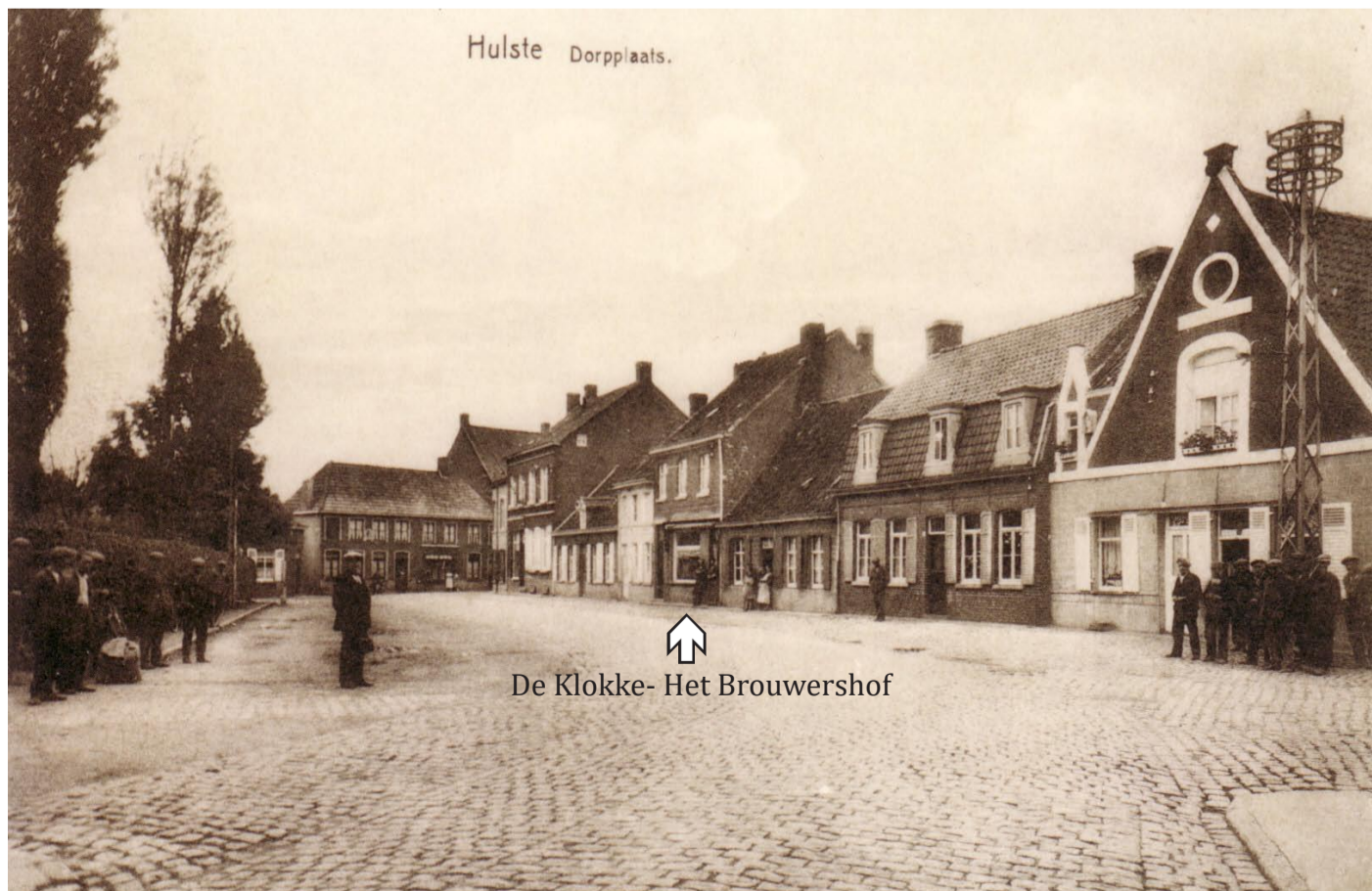
Zicht op de dorpplaats met het tweede huis vanaf rechts De Sportkring , één huis tussen en dan De Klokke-Het Brouwershof met daarnaast Café de la Poste en dan De Gouden Kloef-t Kloefke .